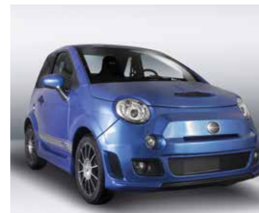
La Sport tire logiquement son inspiration chez Abarth.

B8 au style plus agressif. S'inspirant de la 500 Abarth, cette B8 Sport sort le grand méchant look : jantes de 15 pouces, bouclier avant plus aéré et aux lignes marquées, capot spécifique avec une entrée d'air façon Mini Cooper S... A l'intérieur, on note la présence de sièges baquets spécifiques, d'une décoration de console centrale couleur carrosserie, ainsi que d'un système multimédia avec écran tactile. Par ailleurs, cette version est la seule à disposer de série du double fond de coffre optionnel sur les autres B8, très pratique et unique sur le marché.