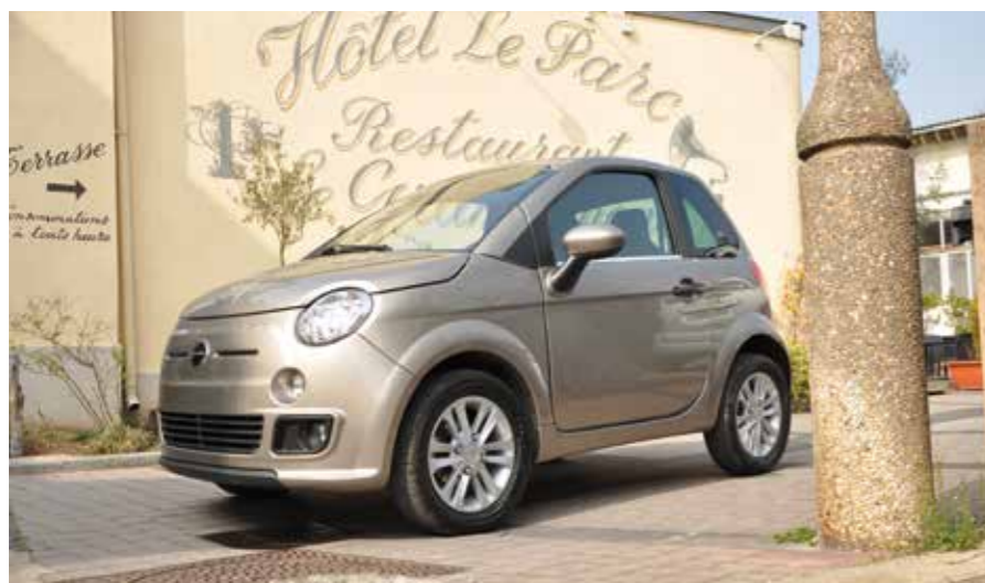
La Bellier B8 ne peut cacher sa ressemblance avec la FIAT 500.

Plus pimpante que la Série B d'entrée de gamme, la Série C adopte des jantes alliage de 14 pouces, des antibrouillards, ainsi qu'un habillage des montants. L'équipement s'enrichit d'un autoradio CD MP3, d'un radar de recul et d'un essuie-glace arrière. Le nuancier est assez étendu, même si certaines teintes demeurent optionnelles. Depuis quelques mois, la finition haut-de-gamme Série L dotée d'un look et d'un équipement plus riches (chrome, jantes diamantées, pack multimédia...) a disparu du catalogue, mais Bellier propose toutes les options sur la Série C pour retrouver le standing de ce défunt modèle. Trois motorisations sont