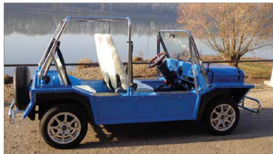
La E-Moke est exactement identique à la NoSmoke d'il y a six mois.