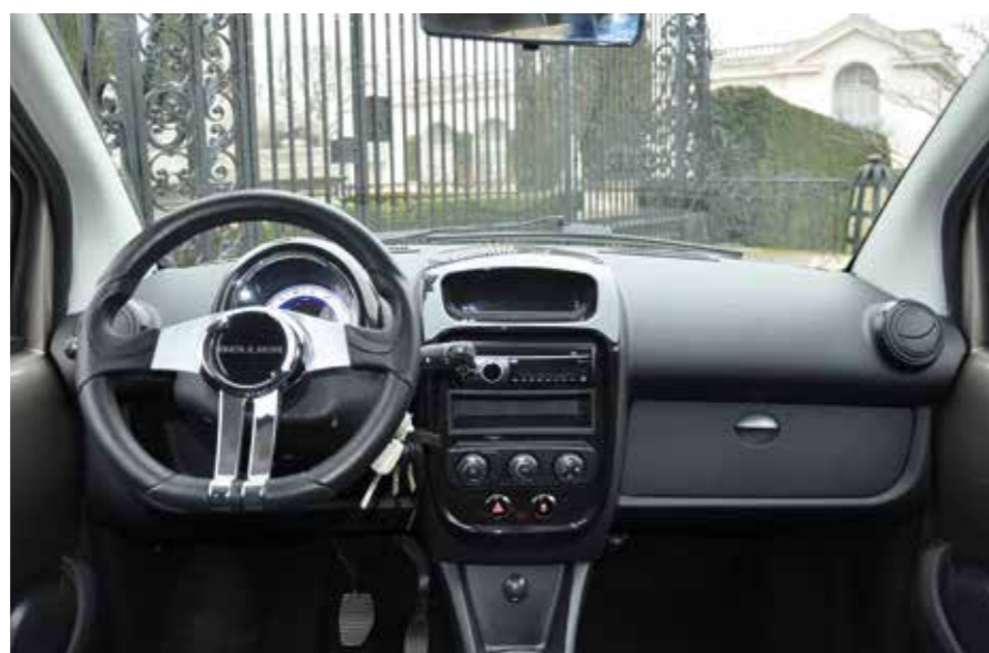
A l'intérieur, de nombreux éléments sont repris de l'ancienne Citroën C1.

Lancée au début de l'année 2015, la Bellier B8 a pris la suite de la Jade, vieillissante et au dessin peu équilibré. Echaudé par les problèmes de qualité sur les carrosseries fabriquées en Chine de ce dernier modèle, le constructeur vendéen a décidé de rapatrier toute la production en France, les coques étant désormais fabriquées à la Mothe-Achard chez Gréau Polyester, à quelques encablures de l'usine de Talmont Saint-Hilaire. Avec ses faux airs de Fiat 500 (dont elle reprend les phares et rétroviseurs) et ses qualités réelles, cette auto a tous les atouts pour relancer durablement la marque. Comme chez Casalini, la coque en polyester permet toutes les fantaisies quant aux couleurs. Bellier ne compte pas s'en priver. Un élargissement de la gamme est prévu, avec pour commencer une version électrique.