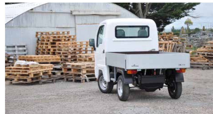
Le Docker allie compacité et aspects pratiques.

L'utilitaire sans permis de Bellier a déjà une longue carrière derrière lui. Pourtant, l'arrivée il y a trois ans d'une nouvelle cabine lui a donné un second souffle. Directement comparable au Casalini Kerry, ce modèle présente comme ce dernier une architecture à cabine avancée qui favorise la compacité et le rayon de braquage.